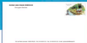
ENVELOPPES SANS FENETRE format 22x11 cm