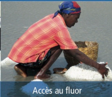
Accès au fluor