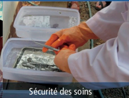
Sécurité des soins

AOI - 1, rue Maurice Arnoux - 92120 Montrouge Tél. : 01 57 63 99 68 - contact@aoi-fr.org - Code ICS : FR42 ZZZ 474069