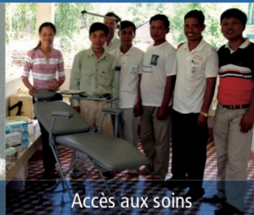
Accès aux soins